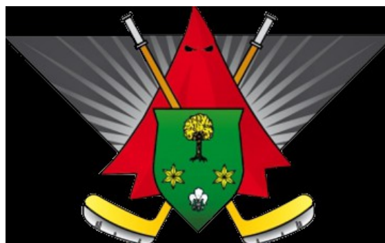
kapitán týmu Požár Z.