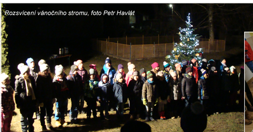
Rozsvícení vánočního stromu