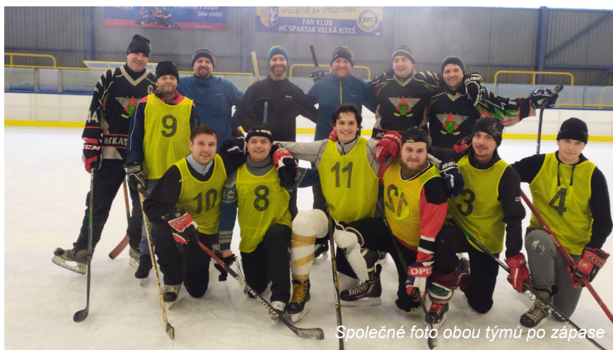
Společné foto obou týmů po zápase

Tradiční katovské hokejové utkání ženatých proti svobodným se v bítešské hokejové hale uskutečnilo již ve čtvrtek 30. 12. 2021. Soubor, který byl naplněn kvalitními individuálními výkony i nápaditými týmovými akcemi, se odehrál v přátelské a uvolněné atmosféře končícího roku. Zápas tentokrát vítěze nenašel, když se skóre zastavilo na hodnotě 11:11. Již teď se těšíme na další poutavé mače našich borců.