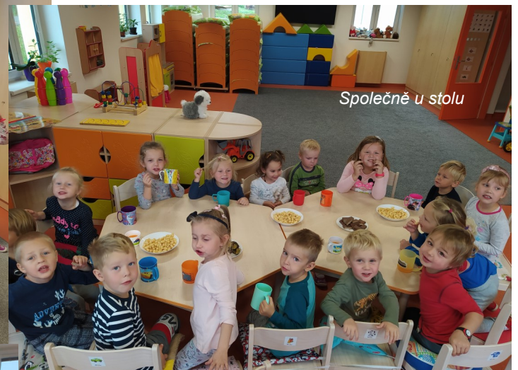
Společně u stolu