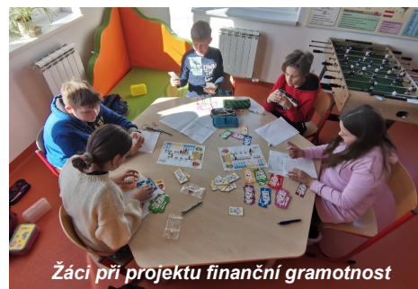
Žáci při projektu finanční gramotnost