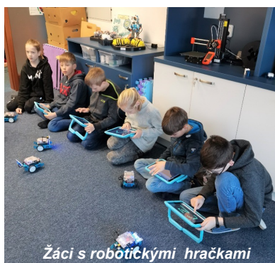
Žáci s robotičkami hračkami

Paní lektorka nás učila o finanční gramotnosti. Víte, co to je? Finance jsou PENÍZE a gramotnost znamená dovednost-UMÍM. Dohromady je to UMÍM ZACHÁZET S PENĚZI. Řekli jsme si, jak dřív vypadal rodinný rozpočet, zda je lepší mít větší příjmy a menší výdaje či naopak. Povídali jsme si o tom, za co lidé utrácejí peníze, že je potřeba utrácet s rozvahou. Paní lektorka nám vysvětlila, jaký je dobrý dluh a jaký špatný. Během programu jsme si zahráli tři hry – výměnný obchod se zvířaty, potom i s penězi. Poslední byla desková hra, kde jsme již nakupovali a prodávali zboží. Program se nám líbil, dozvěděli jsme se spoustu zajímavých věcí, které se nám určitě budou hodit.