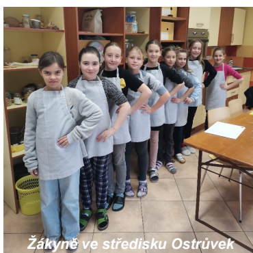
Žákyně ve středisku Ostrůvek