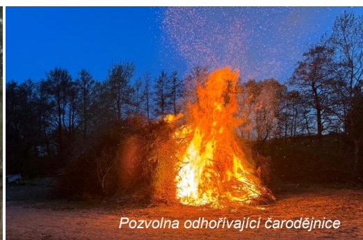
Pozvolna odhořívající čarodějnice