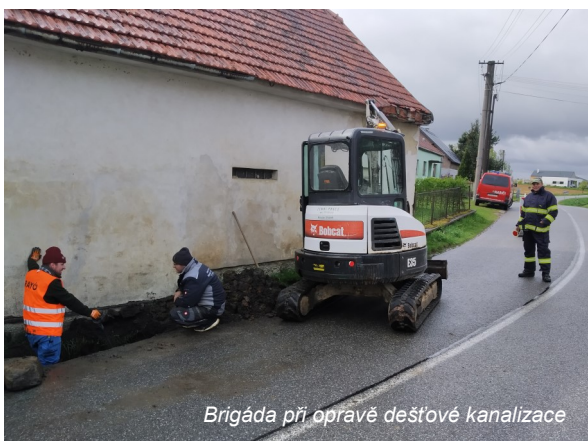
Brigáda při opravě dešťové kanalizace

Milí spoluobčané, přeji vám pěkné dny probíhajícího pokročilého jara a těším se na další setkání s vámi, třeba při akcích, které jsou v naší obci připravovány na nejbližší dobu a o nichž se dočtete na dalších stranách zpravodaje.