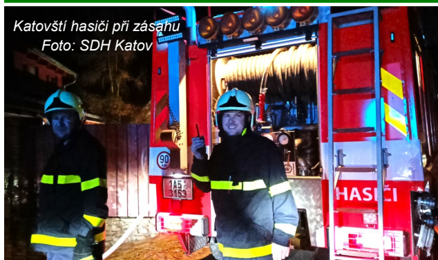
Katovští hasiči při zásahu

Dne 8. února 2025 v nočních hodinách byl operačním střediskem HZS Jihomoravského kraje vyhlášen výjezd k požáru rodinného domu v naší obci. Na místo události se jako první dostavila místní jednotka hasičů s vozidlem CAS LIAZ K 25 v počtu 1+6. Po provedeném průzkumu se vytvořily postupně tři útočné proudy k hašení stropu okolo komína. V průběhu zásahu se na místo dostavily další jednotky, a to HZS Velká Bíteš a Tišnov a SDH Kuřimské Jestřabí. Velení zásahu si převzala jednotka z Tišnova. Provedlo se střídání uvnitř objektu příslušníky v dýchací technice a rozebráním stropu kolem komína byl požár likvidován. Na místě ještě zůstali místní hasiči s úkolem dohledu na případné opětovné rozhoření.