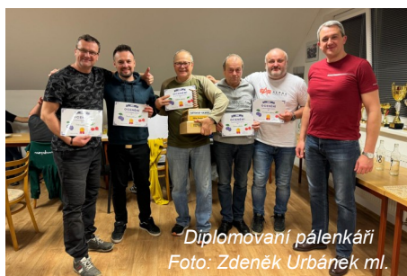
Diplomovaní pálenkáři