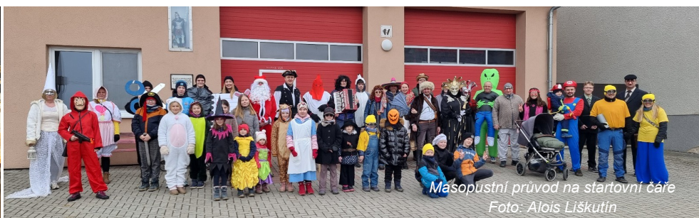
Masopustní průvod na startovní čáře